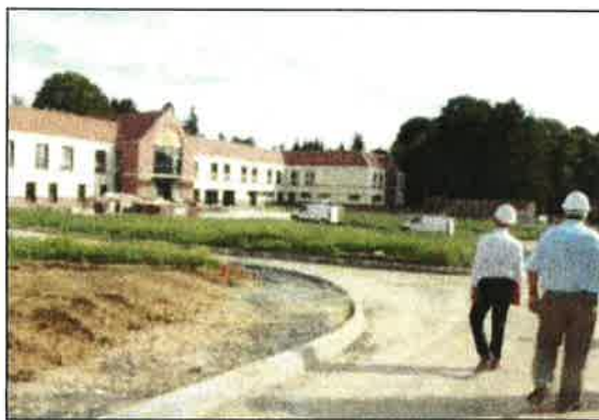
Lors d'une visite de chantier, mercredi. C'est sur cette imposante façade que débouche l'accès créé sur la rue du M-Mortier.

Les 4 800 m 2 du bâtiment dont la construction a été lancée en avril 2011 se sont logés sur un terrain de 19 000 m 2 , en retrait de la rue de Fesmy. Il a fallu à l'architecte Yazid Amrouche et à son collègue Laurent Percheron jongler avec l'important dénivelé sur cette large parcelle, et se concilier les faveurs de l'architecte des bâtiments de France en aménageant l'entrée du côté de la rue du Maréchal-Mortier. Passé un porche « réhabilité, ainsi que le portail, pour en garder le cachet », un chemin débouche en plein milieu de l'impressionnante façade : « On a travaillé le bâtiment autour de cet axe », expliquent les maîtres d'œuvre de ce chantier, chiffré à 7 M € pour le volet travaux, et 2 autres millions pour l'équipement des locaux. L'établissement d'hébergement